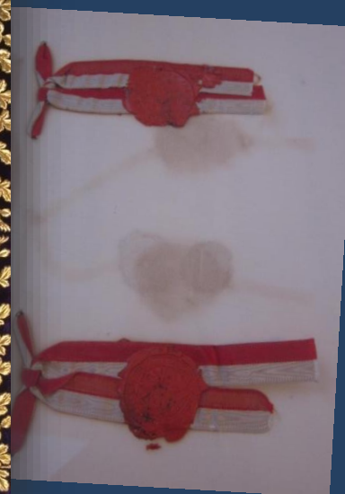
Originale secondo trattato di amicizia e commercio italo giapponese Roma, 1 dicembre 1894 In ASMAECI – trattati bilaterali non più in vigore, f. "giappone" – pos. 3